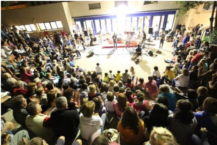
ALLA VIGILIA DELLA LORO FESTA