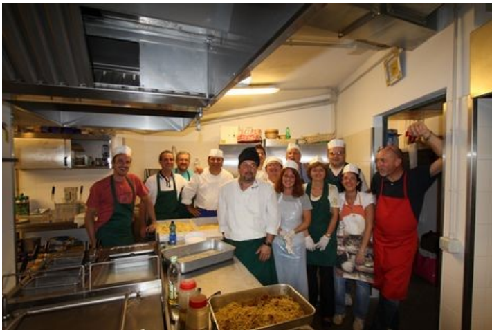
FELICI PER I 900 PASTI SERVITI