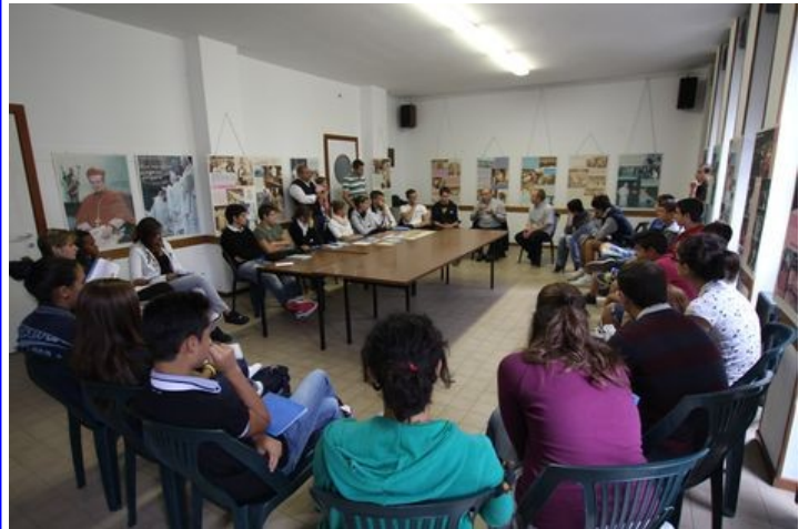
SIGNIFICATIVA LA CONCENTRAZIONE..