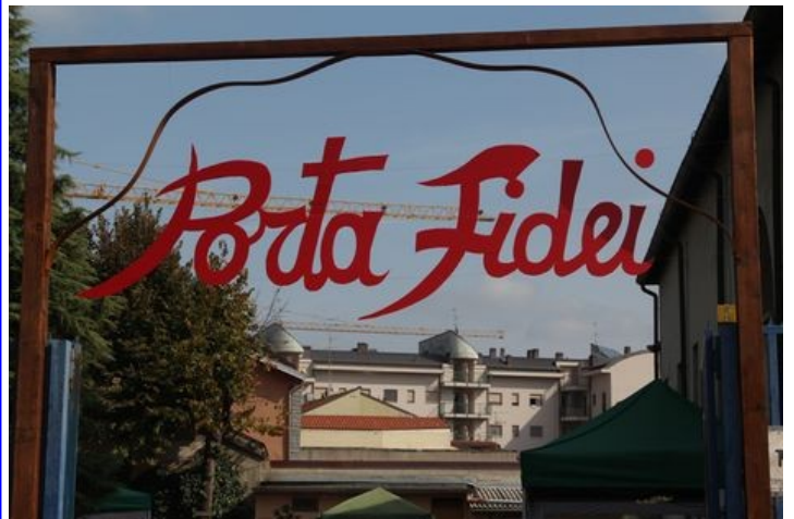
ANNUNCIO DELL'ANNO DELLA FEDE 11/10